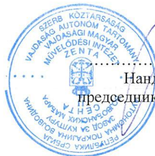
Нандор Ујхељи председник управног одбора