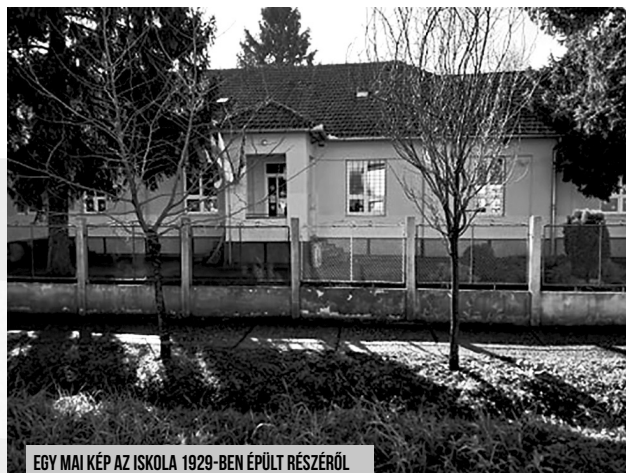
EGY MAI KÉP AZ ISKOLA 1929-BEN ÉPÜLT RÉSZÉRŐL (, 2021.01.30.)

Az asztalok kissé ferdek voltak, egy tintás üvegek tartására kialakított lyukkal.