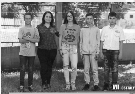
OSZTÁLYKÉP 2020-BÓL – A TAVALYI CSOPORTKÉP AZ OSZTÁLYUNKRÓL

A templom melletti másik régi iskola valamivel túlélte sorstársát, a Vilma téri iskolát. Falai között (a visszaemlékezések szerint) még 1969-ben is oktatás folyt, majd ezek után itt is megszűnt a tanítás. Az 1970-es években pedig lakásokká alakították át tágas tantermeit. Ebben az új funkciójában még ma is helyt áll, de már semmi köze az oktatáshoz – a tanuláshoz ámbár annyi van, hogy az itt kialakított lakásokban mindig fiatal családok éltek, és tágas udvarán eddig soha nem szűnt meg a gyerekszívaj, a játék.