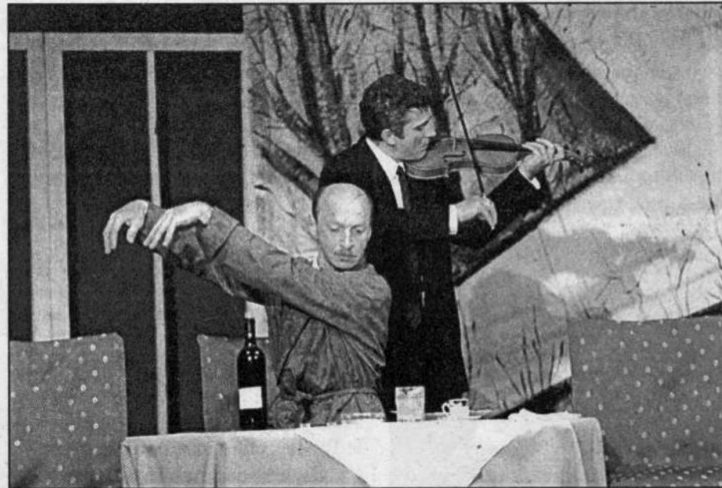
Jelenet a Biedermann és a gyűjtogatók című győztes előadásból