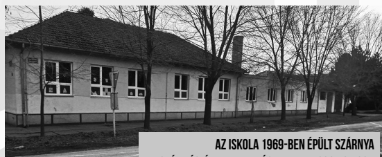
AZ ISKOLA 1969-BEN ÉPÜLT SZÁRNYA

Ezek a körülmények szükségessé tették az új iskola bővítését. Ez az új, központi iskola 1969-ben lett átalakítva, illetve kibővítve három új tanteremmel, egy műszaki oktatásra alkalmas teremmel, valamint irodahelyiségekkel.