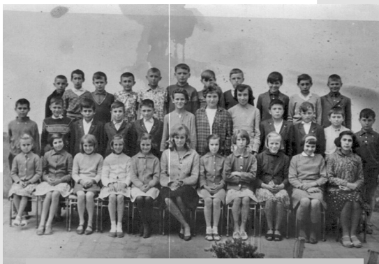
OSZTÁLYKÉP AZ 1960-AS ÉVEKBŐL (AZ ISKOLA ARCHÍVUMÁBÓL)