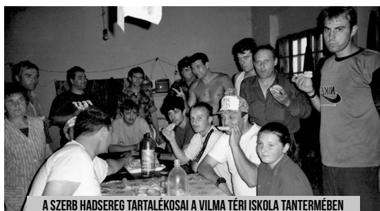
A SZERB HÁDSEREG TARTALÉKOSAI A VILMA TÉRI ISKOLA TANTERMÉBEN (CSIKITY ANNA TULAJDONA, AZ 1990-ES ÉVEKBEN)

Ennek az épületnek az utolsó méltatlan szolgálata az 1990-es végén volt, amikor az állam kaszárnyaként használta, és tartalékos katonákat költöztettek az épületbe. Ma már semmilyen funkciója sincs, hacsak nem az, hogy hirdesse az ifjabb nemzedékeknek, hogy falai között nagyon sok gyerek értékes kincsre lelt, a tudás kincsére.