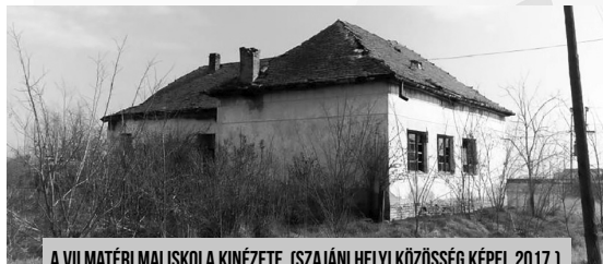
A VILMATÉRI MAI ISKOLA KINÉZETE (SZAJÁNI HELYI KÖZÖSSÉG KÉPEI, 2017.)

Az úgynevezett új iskola születésével, állandó bővülésével elkerülhetetlen volt a régi iskolák működésének hanyatlása, végső soron a megszűnése is. A Vilma téri iskola a II. világháború utáni tanügyi reformok és rendeletek áldozatává vált, s az 1950-es évek elején végleg bezárta kapuit. Egy ideig használták még, olykor-olykor szavazóhelyiségnek, s így négyvenként egyszer lekerült róla a lakat.