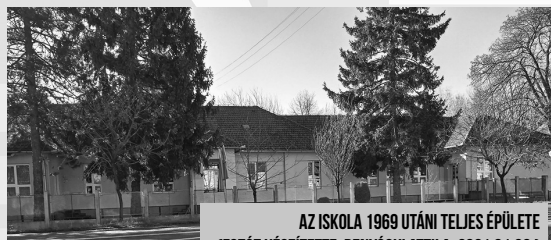
AZ ISKOLA 1969 UTÁNI TELJES ÉPÜLETE

Azonban a további bővítésre sem kellett túl sokat várni, mert 1980-ban egy tágas tornateremmel, a hozzá tartozó öltözőkkel és egy, az akkori viszonylatban korszerű fűtőházzal bővült. Így azóta is maradéktalanul tudja teljesíteni feladatát, a szajáni gyerekek oktatását-nevelését.